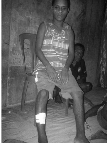
Foto salah satu korban yang terkena tembakan peluru nyasar

Ketiga , praktik kriminalisasi dan rekayasa kasus. Kriminalisasi terjadi dengan banyak faktor, diantaranya minimnya skill pembuktian sebuah kasus kejahatan sehingga menyebabkan terjadinya salah tangkap yang berujung dengan kriminalisasi terhadap warga masyarakat yang tidak bersalah. Kriminalisasi juga terjadi karena tidak maksimalnya atau minimnya independensi aparat kepolisian sehingga dengan mudah relasi desakan pihak-pihak tertentu yang memiliki “power” dapat ditindaklanjuti oleh aparat kepolisian. Dan meski korban tidak terbukti bersalah di Pengadilan, Polisi tidak memiliki inisiatif untuk memberikan pemulihan terhadap hak-hak korban 30 .